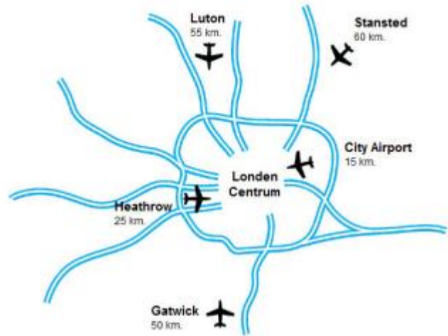
Ligging van de luchthavens in Londen

De naam zegt het al. London City Airport ligt praktisch in de stad. Vanuit dit kleinschalige airport ben je dan ook snel in het centrum van Londen. Voor zakenreizigers die in The City of Canary Wharf moeten zijn is dit vliegveld ideaal. Dankzij de ligging maar ook vanwege de korte inchecktijden ontdekken steeds meer toeristen London City Airport. De tarieven van de vliegmaatschappijen die op City Airport vliegen zijn zeer concurrerend. Vanuit Nederland vliegt CityJet direct naar dit vliegveld. Vertrekken kan inmiddels vanaf Eindhoven, Rotterdam en Amsterdam. London City Airport heeft een klein tax free shopping gedeelte maar lang hoeft u niet door te brengen op dit vliegveld. Inchecken voor je vlucht kan tot 20 minuten voor vertrek (zonder bagage) en 30 minuten met bagage!