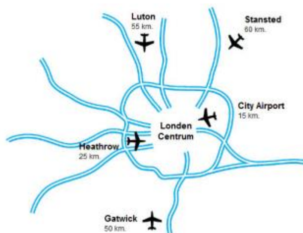
Ligging van de luchthavens in Londen

De naam zegt het al. London City Airport ligt praktisch in de stad. Vanuit dit kleinschalige airport ben je dan ook snel in het centrum van Londen. Voor zakenreizigers die in The City of Canary Wharf moeten zijn is dit vliegveld ideaal. Dankzij de ligging maar ook vanwege de korte inchecktijden ontdekken steeds meer toeristen London City Airport. De tarieven van de vliegmaatschappijen die op City Airport vliegen zijn zeer concurrerend. Vanuit Nederland vliegt CityJet direct naar dit vliegveld. Vertrekken kan inmiddels vanaf Eindhoven, Rotterdam en Amsterdam. London City Airport heeft een klein tax free shopping gedeelte maar lang hoeft u niet door te brengen op dit vliegveld. Inchecken voor je vlucht kan tot 20 minuten voor vertrek (zonder bagage) en 30 minuten met bagage!